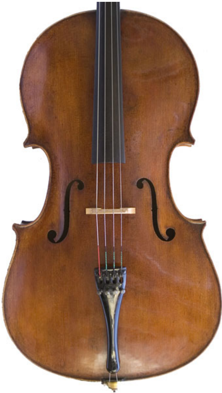
Decke Josef Guarneri Kopie