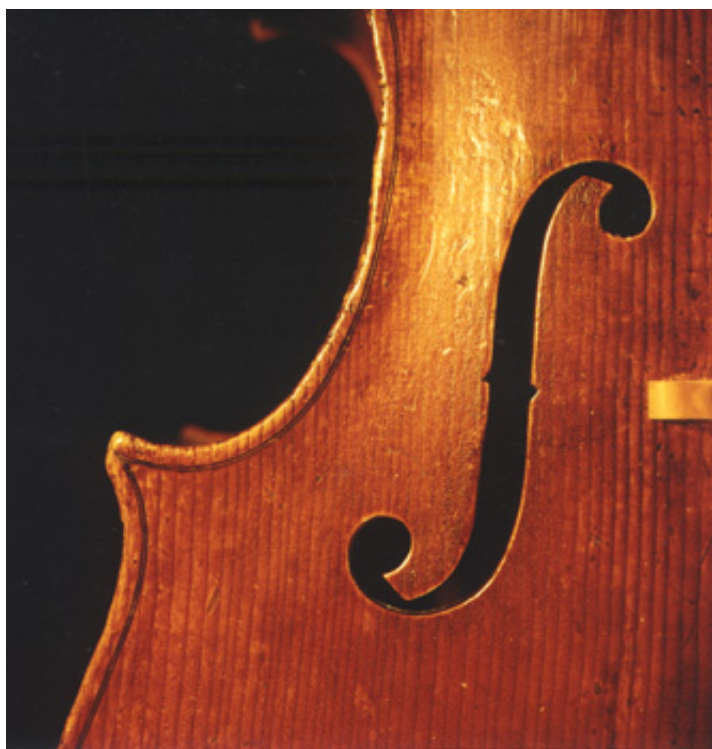
Detail F-Loch Cello Domenico Montagnana