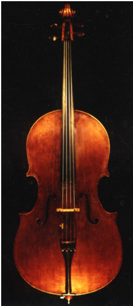
Decke Domenico Montagnana 1735

Unser Montagnana Modell entspricht dem von Boris Pergamentschikow(1735 gebaut) gespielten Instrument, ein kerniges und sehr voluminöses Instrument.