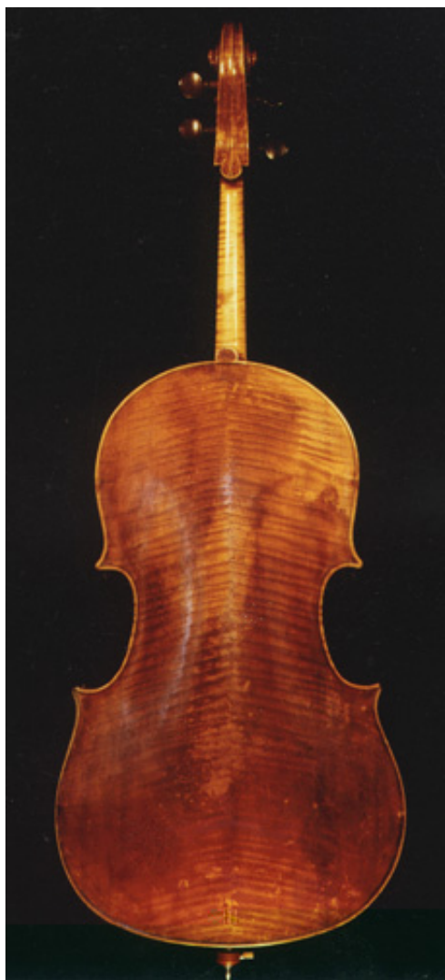
Boden Cello Domenico Montagnana 1735